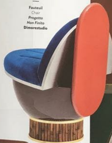
Fauteuil Chair Progetto Non Finito Dimorestudio