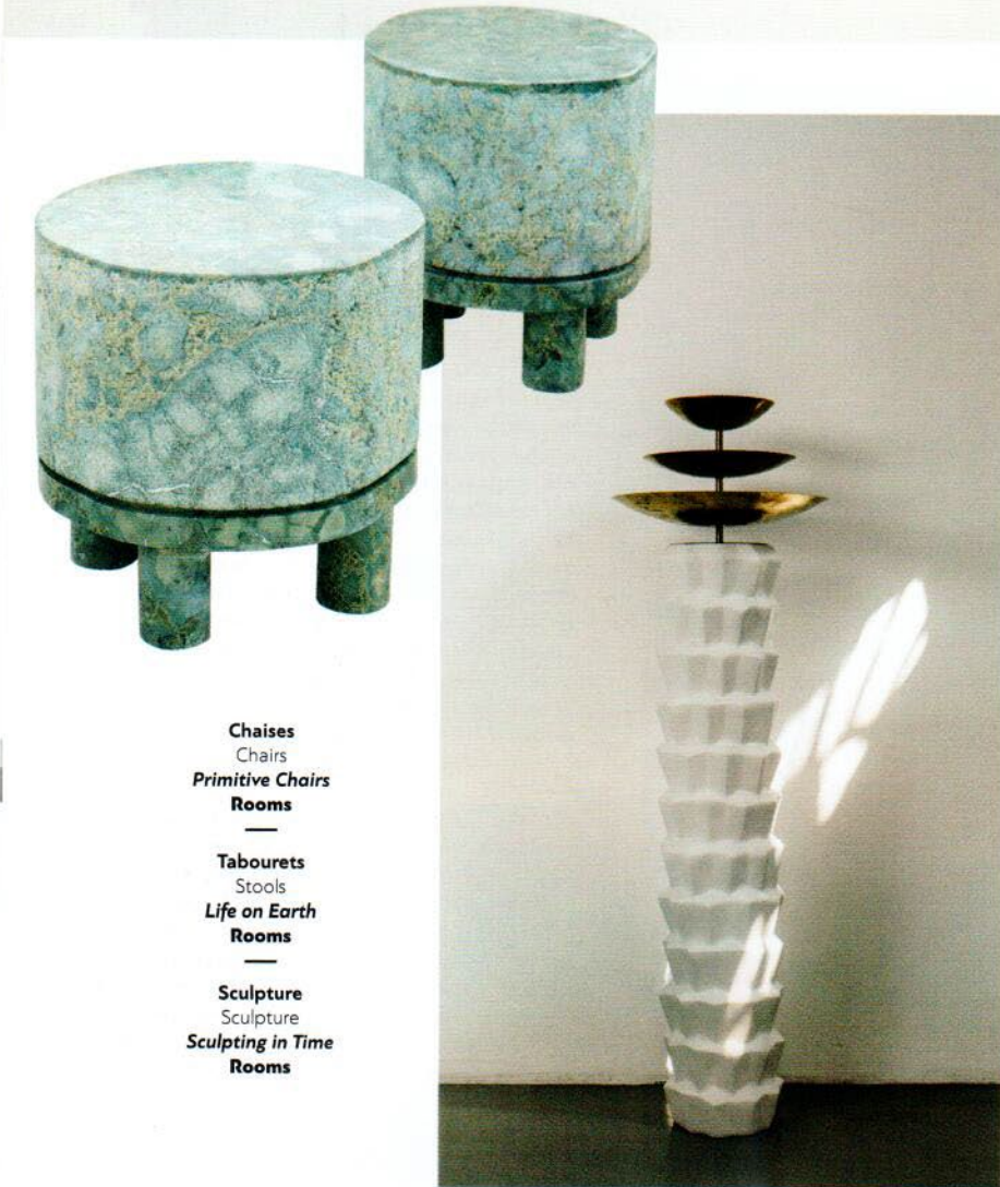
Chaises Chairs Primitive Chairs Rooms