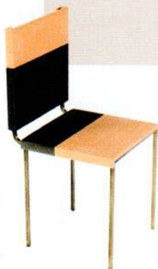
Chaise en terre cuite et métal. Terracotta and metal chair. 45 x 45 x h 90 cm, Materia Matter , Architetti Artigiani Anonimi.

The Marsha and James floor lamps in handmade ceramic by Armelle Benoit and Salomé Gendron for Pierre Yovanovitch (R & Company).