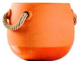
Vase en terre cuite et corde. Terracotta and rope vase. ø 30 x h 26 cm, design Marcel Wanders, Silo Vase , Natuzzi.