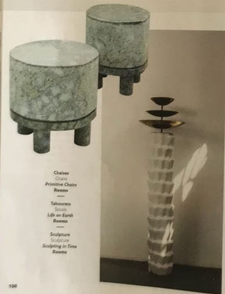
Chaises Chairs Primitive Chairs Rooms — Tabourets Stools Life on Earth Rooms — Sculpture Sculpture Sculping in Time Rooms