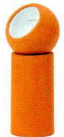
Lampe en terre cuite. Terracotta lamp. ø 12 x h 29 cm, design Lauren Van Driessche, Terra Light , Serax.