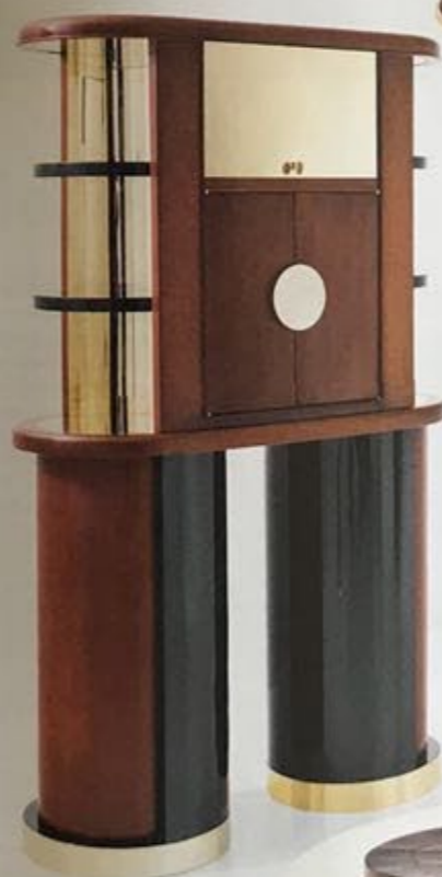
Buffet Buffet Limited Editions Dimorestudio