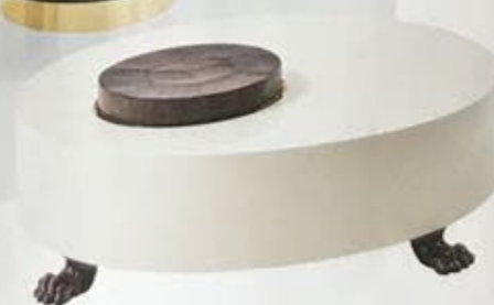
Table basse Coffee table Limited Editions Dimorestudio