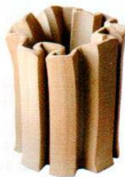
Vase en céramique. Ceramic vase. 120 x h 30 cm, design Floris Wubben, Jessica Art Gallery.